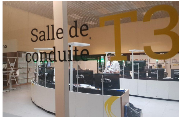
La Presse de la Manche

Après un mois et demi de conflit et 4 longs week-ends, la Direction a enfin tenu une négociation spécifique à la revalorisation du régime 5x8 avec comme principal résultat : l'augmentation en 3 ans de 135€ de la prime de poste.